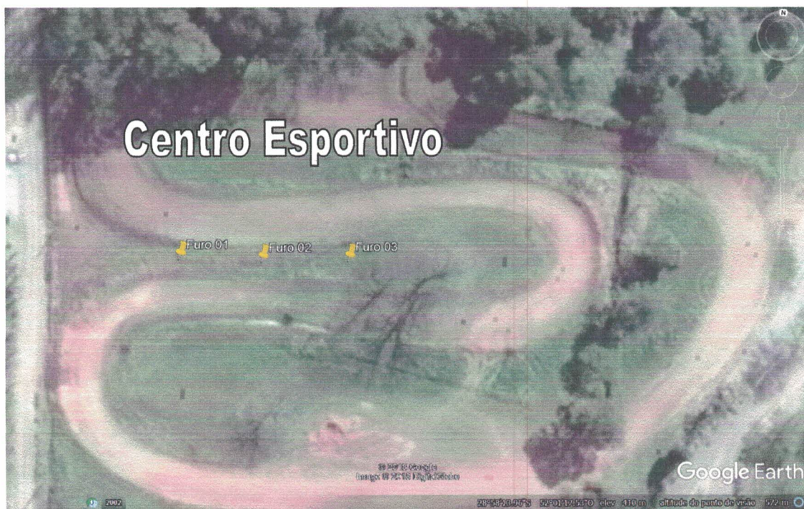
Localização da construção do Centro Esportivo.