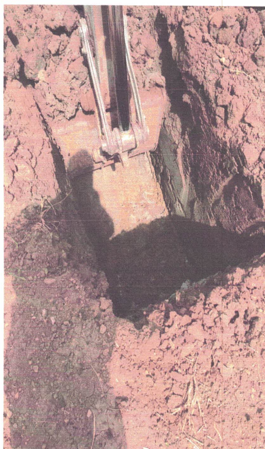
Material argiloso de alta compactação até profundidade de 1,60m.