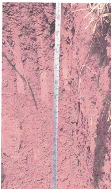
Furo para Inspeção do Solo junto local execução do Centro Esportivo