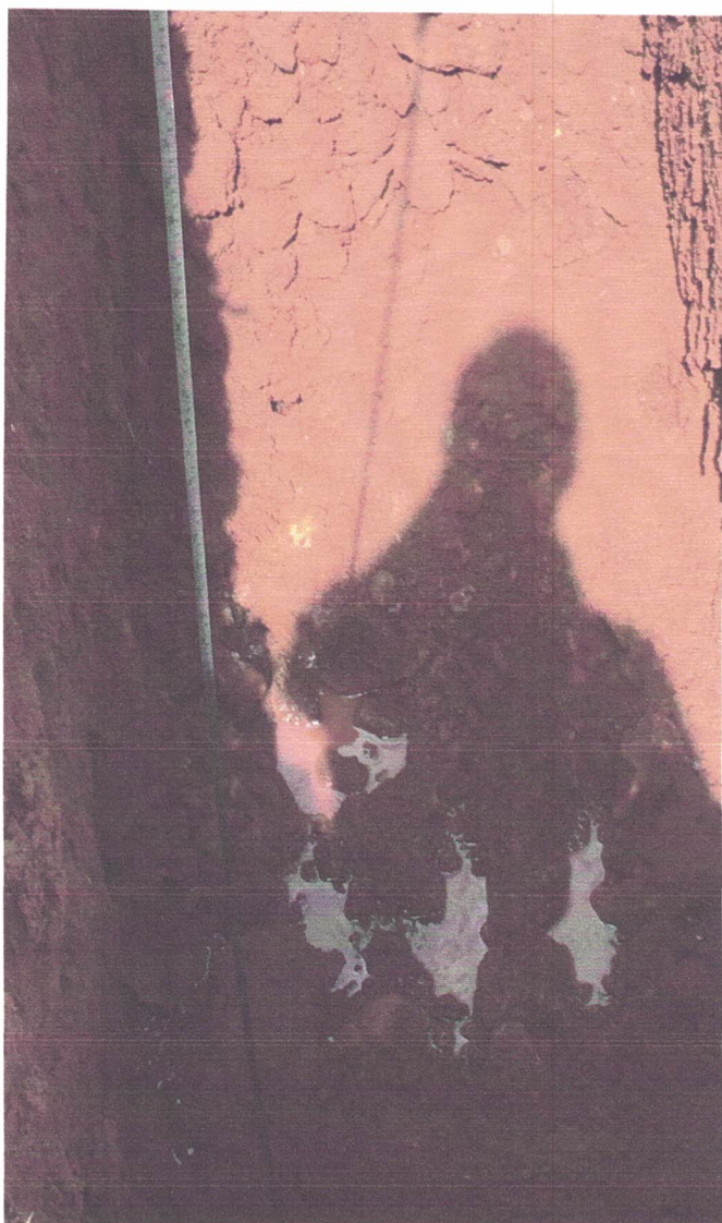
Encontrada rocha na profundidade de 1,60 metros.