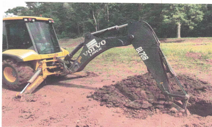
Furos feitos com retroescavadeira para definição das fundações do Centro Esportivo