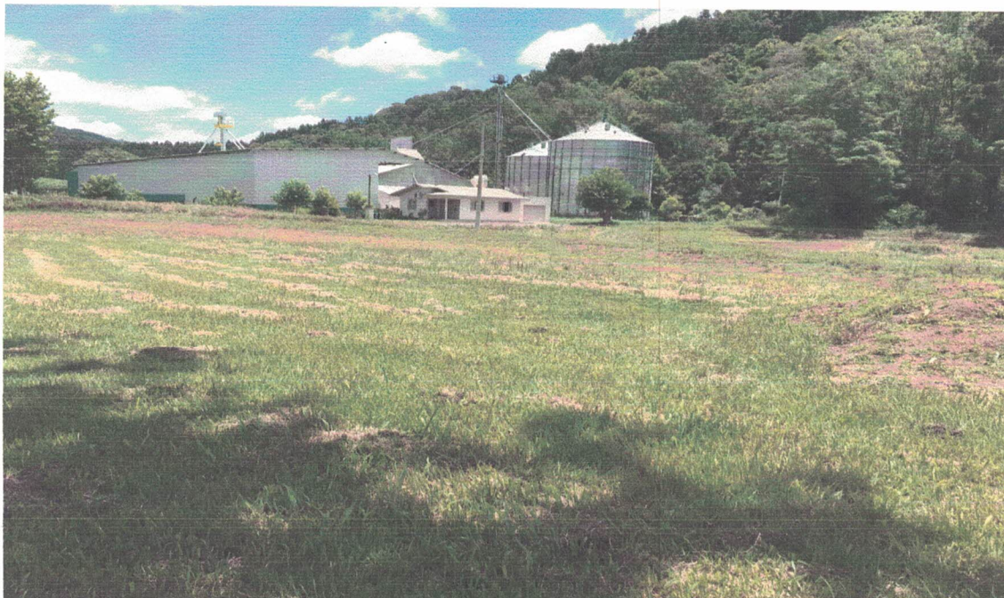
Local onde será executada a obra.