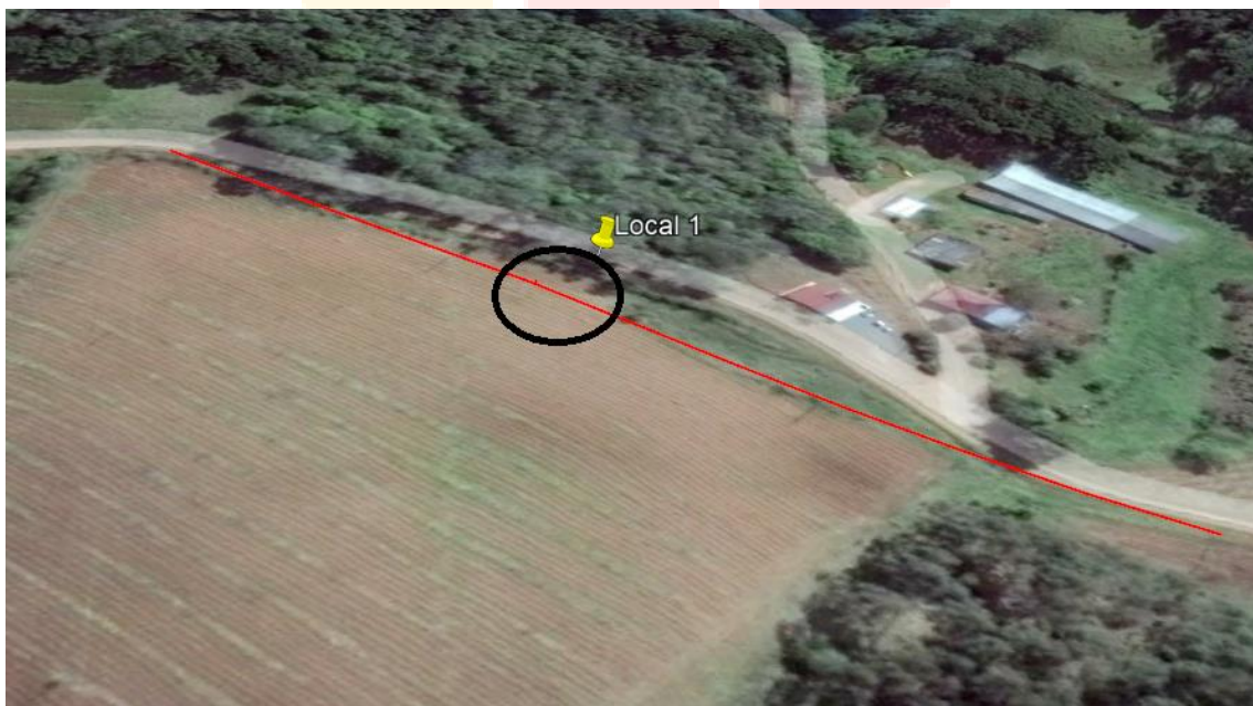
Figura com a localização indicada para perfuração com coordenadas 28°57'33.41"S 52° 3'11.34"O.

A figura acima ilustra o resultado da geofísica para o local 1 constatando a melhor opção dentre os locais apresentados.