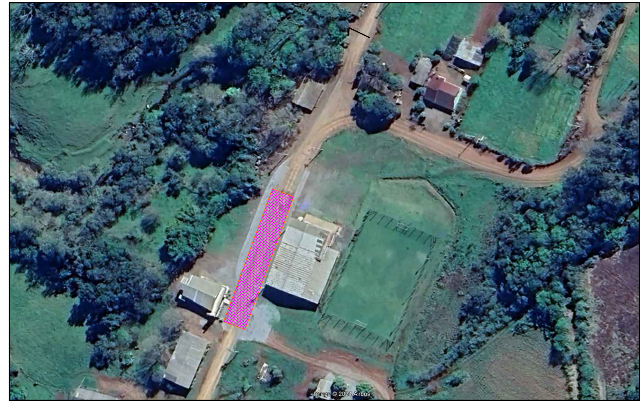
PLANTA DE LOCALIZAÇÃO ESCALA: 1/1000