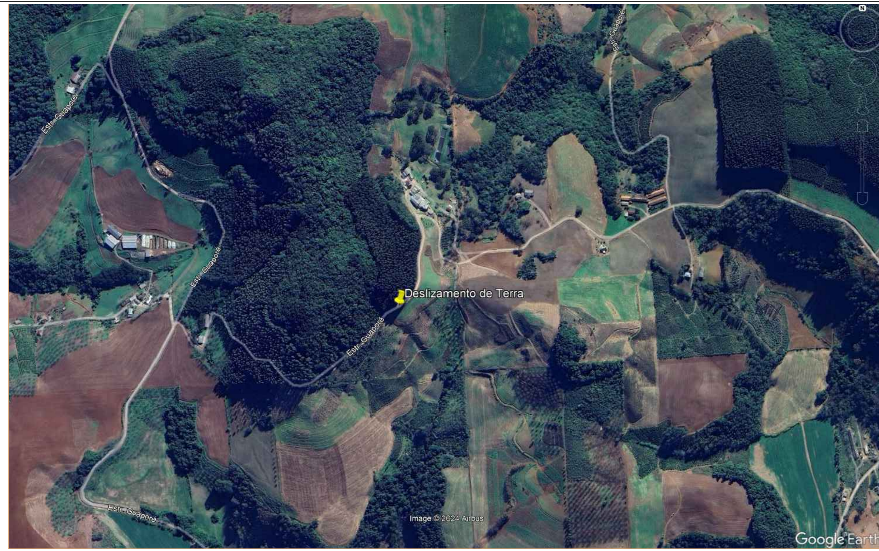
PLANTA DE LOCALIZAÇÃO ESC.: 1/500 (EM m)